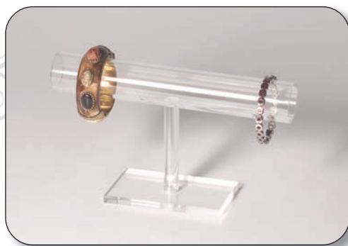
■ 01621008T0 Exhibidor pulseras tubular Medidas 24x6x11 cm.