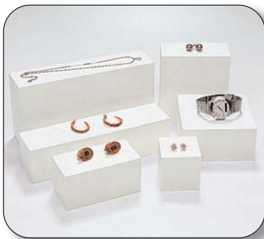
Plataforma exhibidor ■ T15025D700 24x12x6 cm ■ T15024D700 24x6x6 cm ■ T15023D700 12x12x6 cm ■ T15022D700 12x6x6 cm ■ T15021D700 6x6x6 cm