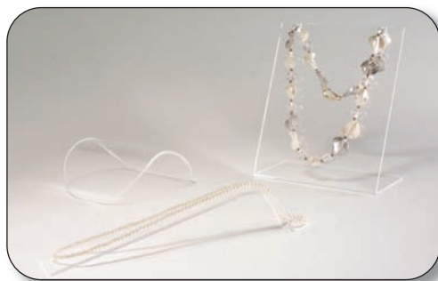
■ 01607017T0 Exhibidor collares plano Medidas 17x14x7 cm. ■ 01638004T0 Exhibidor collares alargado Medidas 23x4x4.5 cm. ■ 01621005T0 Exhibidor collares curvado Medidas 12x12x4 cm.