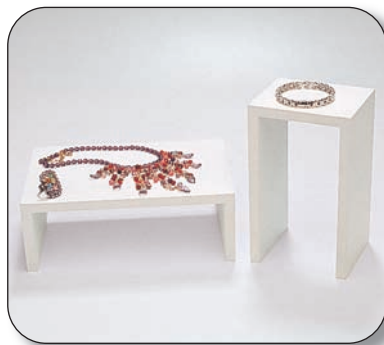
Exhibidor ■ T15020D702 de 20x12x10 cm ■ T15020D704 de 9x25x17 cm