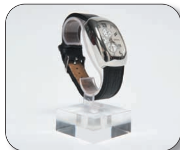
■ 01630005T0 Exhibidor relojes transparente