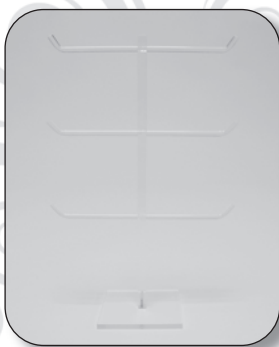
■ 01621009T0 Exhibidor pulseras transparente Altura 41 cm.