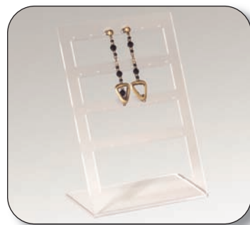
■ 01616018T0 Exhibidor pendientes Medidas 12x6x18 cm.