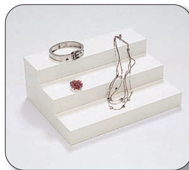
Plataforma exhibidor ■ T15021D701 24x6x3 cm ■ T15022D701 24x12x3 cm ■ T15023D701 24x18x3 cm