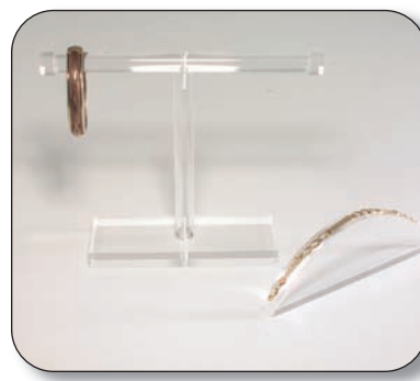
■ 01620007T0 Exhibidor pulseras forma "T" Medidas 15x20x7 cm. ■ 01631005T0 Exhibidor pulseras semiesfera Medidas 17.5x15x5.5 cm.